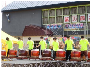
↑山岳太鼓も頑張りました