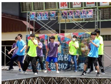
↓体育で練習したダンス

七月十日(日)、第16回こもれび祭が行われました。天候にも恵まれ、多くの保護者の皆様・日高町民の皆様にご来場いただきました。山岳太鼓やダンスなど、日々の授業や産学での練習の成果を見ていただくことができ、充実した学校祭になりました。二学期はさらなる飛躍を楽しみにしています。