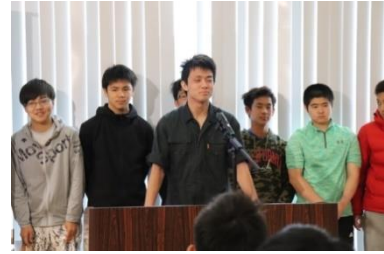
5/30 日勝支部大会壮行会