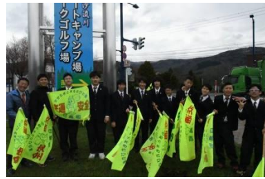
5/7 交通安全街頭啓発