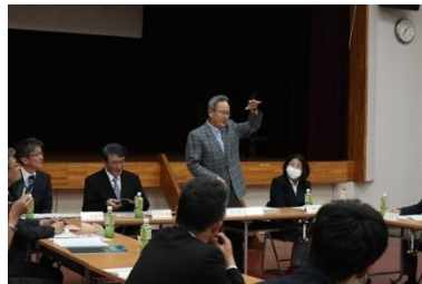
5/28 学校運営協議会 (CS)