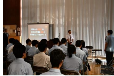
5/30 薬物乱用防止教室