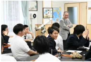
5/17 春季進路出前授業