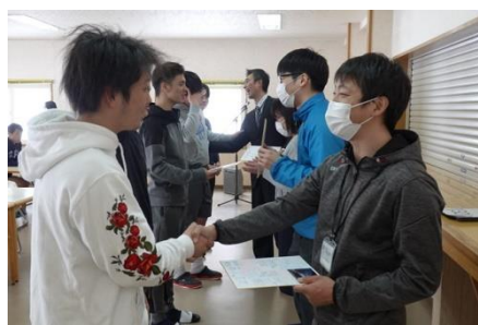
寮ミーティングにて離任者挨拶がありました

います。新校舎移転を機に、寮を含めた学校の環境整備が進み、生徒・学校全体が成長している様子を目の当たりにし、実感することができました。在職中は、多くの生徒や保護者、教職員とともに日高産業学習者、地域の方々とともに日高高校の学校運営に関わることができたことを大変嬉しく思うとともに、この日高の地を離れるに、寂しい気持ちで一杯です。四月からは学校現場ではなく、北海道立教育研究所付属理科教育センターにお世話になり、生徒と接する機会が少なく生じます。また、思い出しながら日々の業務に邁進していきたいと思