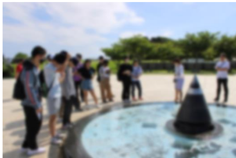
平和祈念公園でバスガイドさんから話を聞きました