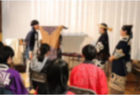
講演等の謝辞では形式的な物ではなく、都度自分の言葉で話しています