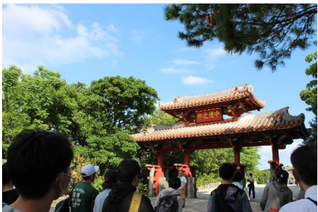
守礼門も見ました(首里城は工事中)