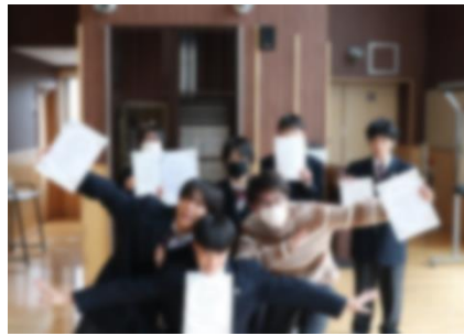
生徒会執行部員の皆さん