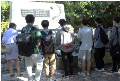
ひめゆり資料館で平和学習

十二月二十二日(金)、二学期終業式が行われ、約四ヶ月にわたる長い二学期が終了しました。今年も二学期はさまざまな行事がありましたね。二年生の見学旅行、体育大会、芸術鑑賞、生徒会役員選挙、課題探究発表会と、たくさん思い出もできたとと思います。一月十五日までの冬休みを、ぜひ有意義なものにしてください。三学期また再びみなさんに会えることを楽しみにしています。 また、三学期は本格的なスキーシーズン到来です。ケガなく楽しくスキーをして、日の高の自然の中で仲間と共にこの冬を謳歌してください。