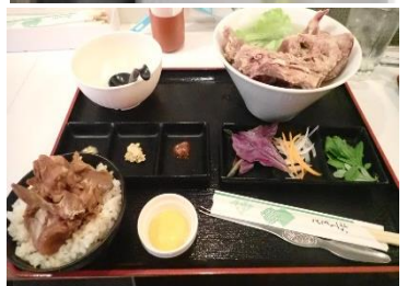
いろいろ食べましたね！