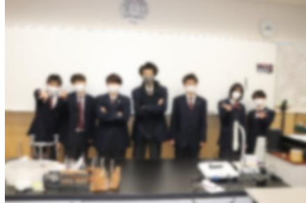
旧生徒会執行部員の皆さん