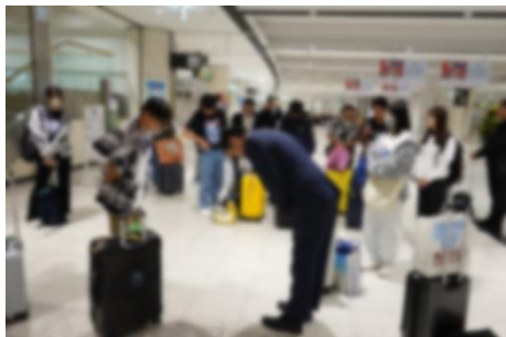
最終日、無事に新千歳空港到着。添乗員さんにお礼を言いました。