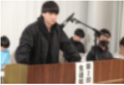
生徒総会で演説する生徒会長

九月二十七日（水）、生徒会役員選挙が行われ、新たな生徒会執行部が発足しました。執行部員は二年生四名、一年生三名の合計七名です。発足後、早速学校紹介のムービーを作成したり、講話の後の謝辞を担当したり、生徒会誌をまとめたり等、日々活動しています。今後は次年度の学校祭について話し合ったり、日高高校をより良くするために継続的に活動していく予定です。 また、旧執行部員の皆さん、これまでありがとうございます。